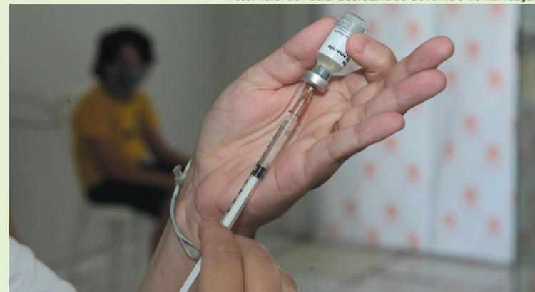
Estão disponíveis 74 salas para atendimento e aplicação das vacinas com horários diferenciados