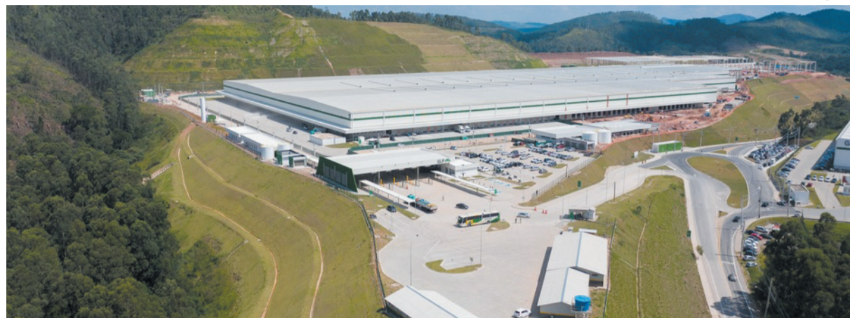
Centro de distribuição em Cajamar, no interior paulista

Minas Gerais entrou definitivamente na rota dos megainvestimentos. A Mercado Livre - empresa argentina de tecnologia volta para o comércio eletrônico - vai instalar um centro de distribuição (CD) em Extrema, no Sul do estado. Considerada uma gigante do segmento na América Latina, a multinacional estima criar 1,4 mil empregos entre diretos e indiretos com a instalação.