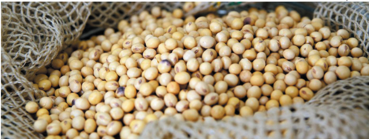
Dados fazem parte do 2º Levantamento de Safra de Grãos 2020/2021 da Conab

A safra mineira de grãos 2020/2021 deve ser de 15,6 milhões de toneladas, com crescimento de 1,7% em relação ao volume anterior. Os dados do período, iniciado no segundo semestre deste ano, fazem parte do 2º Levantamento de Safra de Grãos 2020/2021 da Companhia Nacional de Abastecimento (Conab).